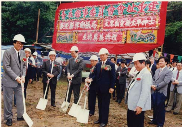
80年代末青衣鄉事委員會新廈動工儀式