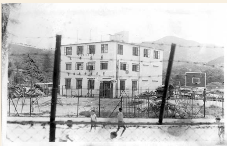
70年代末青衣華僑聯誼會舊貌

在50年代，大量來自潮汕和海陸豐的新移民聚居今日的荃、葵、青地區，並多集中在葵涌北及石籬邨等地。當時荃灣與葵涌一帶的22萬華人，分別有客家人、潮汕海陸豐人、廣府人及外省人。荃灣的客籍原居民與潮汕海陸豐人之間，關係並不和諧。客家村民擁有大部分私人耕地，與當時政府關係亦較好；俗稱「福佬」的潮汕海陸豐人，雖然人數眾多，但他們在區內地位卻不及客家人。 19