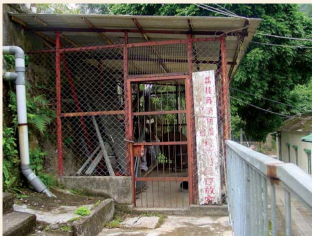
荔枝角消防署消防用具存放室（2003年攝）