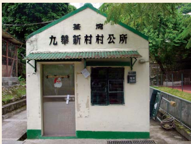
荃灣九華新村村公所（2003年攝）

關於警區的劃分，葵青區共有3間警署，分別是葵涌分區警署、青衣分區警署及梨木樹分區警署。葵涌分區警署所負責的地方範圍包括下葵涌一帶，但不包括九華徑，青衣分區警署則負責整個青衣島的治安。梨木樹分區警署除了管理石蔭、石籬及安蔭一帶地區外，亦負責荃灣東的治安；九華徑的治安則由長沙灣分區警署負責。葵涌與荃灣及九龍的緊密關係顯而易見。