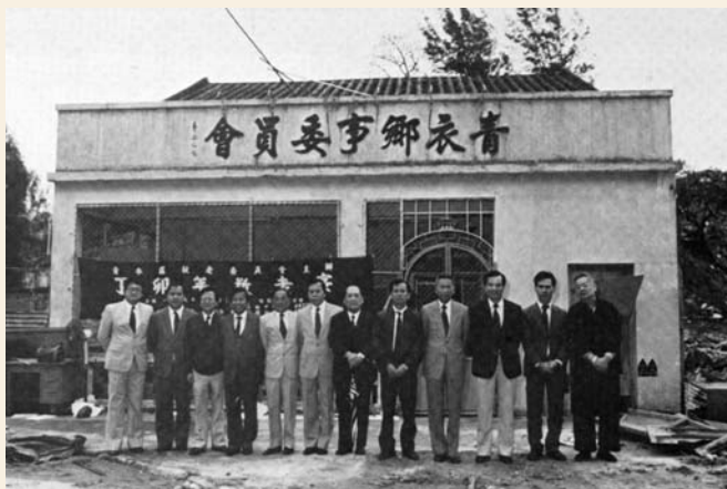
70年代青衣鄉事委員會位於青衣舊墟的舊址

踏入70年代，港府在青衣大規模收地搬村，以興建屋邨，並銳意發展該島。鄉事委員會成為官民之間斡旋議價的重要中介團體。青衣鄉事委員會位於青衣舊墟的原址，亦須拆卸發展，委員會獲撥地在青衣鄉事會路現址重建，新址三層共佔地1,800餘呎，建築費用達260多萬元。 17