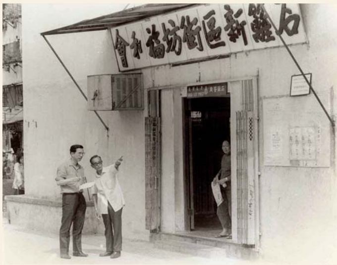
60年代石籬新區街坊福利會