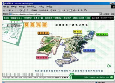
葵青區議會網頁設有「葵青導遊」欄目

2003年區議會聯同葵青民政事務處舉辦了「葵青地區展新姿工程計劃概念比賽」，利用葵芳地鐵站及新都會廣場之間的休憩用地，改建為富有獨特葵青色彩的地標。比賽中的優勝作品以葵涌貨櫃港為主題，配合燈光效果及周邊建築物，展現了葵青區獨特的一面。該冠軍設計將會於2004年落實動工，興建過程需時約一年。 6 工程完成後，葵芳將煥然一新，該處將成為區內的地標之一。