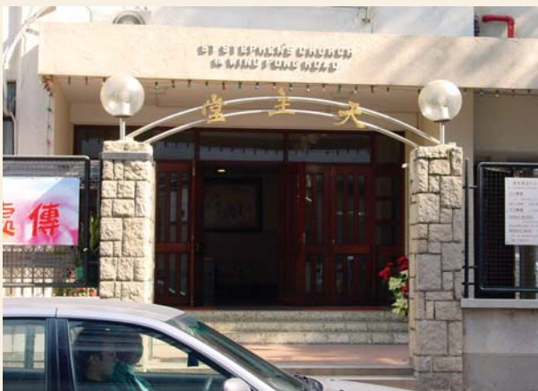
位於葵涌的聖斯得望堂（攝於2003年）