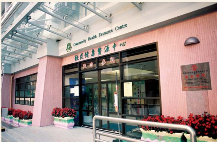
瑪嘉烈醫院社區健康資源中心（2003年攝）

瑪嘉烈醫院是一間植根於葵青區的大型醫院，20多年來一直積極回應社區的需求，提供優質的醫療服務。為配合葵青健康城市及安全社區計劃，瑪嘉烈醫院於2002年1月19日設立了社區健康資源中心，匯聚社區資源，與區內團體共同建設既健康又安全的生活環境。此中心同時全力支援葵青區作為健康城市及安全社區，成為各項活動的聯繫和訓練中心。