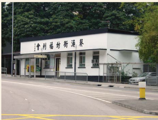
葵涌街坊福利會（攝於2003年）