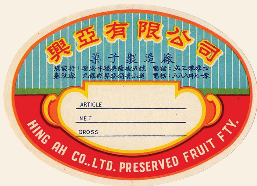
60 年代香港興亞有限公司的招紙，清楚寫明「九龍新界葵涌青山道」的地址。

擁有 85 年歷史的香港興亞有限公司，自 1951 年於青山道興建廠房後，一直以「葵涌青山道」標示其廠址 13 ，並沿用至葵青區議會成立以前。70 年代葵涌區的範圍比今天的大，除前文提及的地區外還包括了梨木樹邨、上葵涌村、中葵涌村、大白田村、打磚坪村及油麻磡村等地方，在它們以南的興亞有限公司亦在葵涌之內。可是，若以今天葵青區的地界為標準，它已不再屬於葵涌，而屬荃灣區。隨著時間的轉變，葵涌地界的變遷可見一斑。