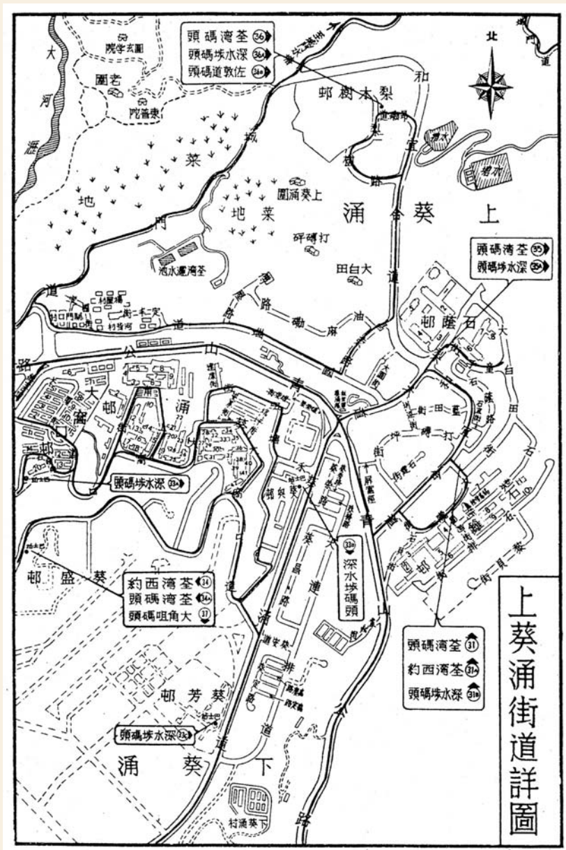
1976的上葵涌區，明顯可見範圍包括上葵涌圍、打磚坪、大白田及梨木樹邨。（轉載自《新界年鑑1976》）

葵涌及青衣長期以來都隸屬於荃灣區，一直沒有獨立而明確的分界。由於當時青衣是島嶼，地界顯而易見，但葵涌西北接荃灣、東南連荔枝角，介乎於九龍及新界之間，地界及屬區不斷變更。