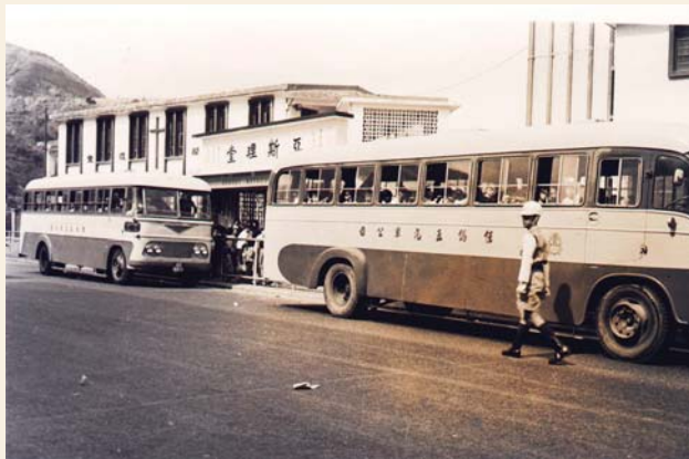
60年代的亞斯理堂

時至今日，葵青區內共有70多間教會及教堂，包括歷史較悠久的崇真堂、浸信會堂、亞斯理堂、聖斯得望堂、荊冕堂及基督教香港信義會天恩堂等。除了宣道宏教外，教會在區內提供不同的社區服務，規模較大的有香港基督教女青年會。該會在長青、石籬及石蔭等地方均設有工作辦事處、社會服務處、幼兒園及松柏中心等，照顧區內不同人士的需要。