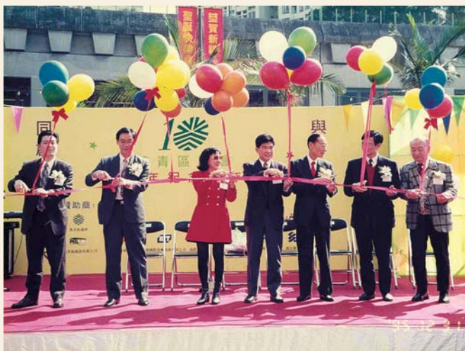
1995年葵青區議會十週年紀念慶典

1980年6月，政府發表《區議會制度綠皮書》，其中包括將新界分成8個行政區，並成立區議會。 4 1981年政府發表《香港地方行政白皮書》及制訂〈區議會條例〉後，各地區議會相繼成立。 5 葵涌及青衣因為早在60年代已列入荃灣新市鎮發展的藍圖之中，故地區議會成立初期便順理成章隸屬荃灣區管理。1984年，夏鼎基爵士在立法會議局上宣布全面檢討地方行政的發展。其後政府建議於1985年3月的區議會選舉中，在廣闊而複雜的荃灣衛星城市另設新的區議會，「葵涌及青衣區議會」遂於1985年4月1日正式成立，並在1988年4月1日易名為「葵青區議會」。自此，葵青區成為獨立的地方行政區。隨著香港主權回歸中華人民共和國，香港特別行政區政府於1997年7月1日成立「葵青臨時區議會」，而香港特別行政區首屆葵青區議會於2000年1月1日開始運作，至2003年12月31日為止，任期為4年。第二屆葵青區議會接續於2004年1月1日起開始運作。