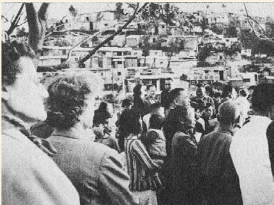
60年代初亞斯理堂為難民提供居所

1959年6月，衛理公會在大窩口山坡興建了共120間石屋，以極低廉的租金租給荃灣海邊一帶500多名的木屋居民。 20 由於在村中佈道和傳教對教會來說十分重要，故此亞斯理堂會於1960年在大窩口建立堂會，同時亦為該村提供青少年、勞工及老人等服務，全盛時期有會員900人。 21 另外，為了解決村內學童的就學需求，早期衛理公會在村內兩所小平房內開辦了私立小學。1960年衛理公會在大窩口的徙置大廈T座地下興辦津貼小學，於1961年9月開學，並與原先在村內的小學合併，成為第一所由衛理公會開設的政府津貼小學，名為「亞斯理衛理學校」。 22 葵涌的亞斯理堂原屬於衛理宗的地方堂會，而在本港其他地方均沒有亞斯理堂，頗具地方特色。 23