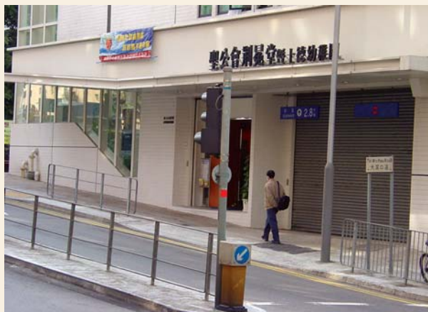
位於大窩口道的聖公會荊冕堂（攝於2003年）