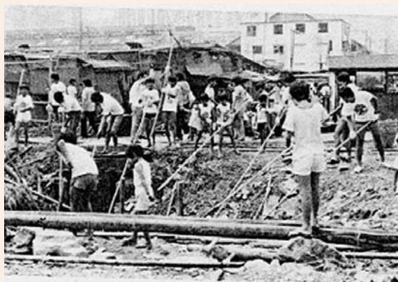
70年代青衣塘互助委員會發動義工進行大掃除情況（轉載自《青衣商會成立五周年紀念特刊》）