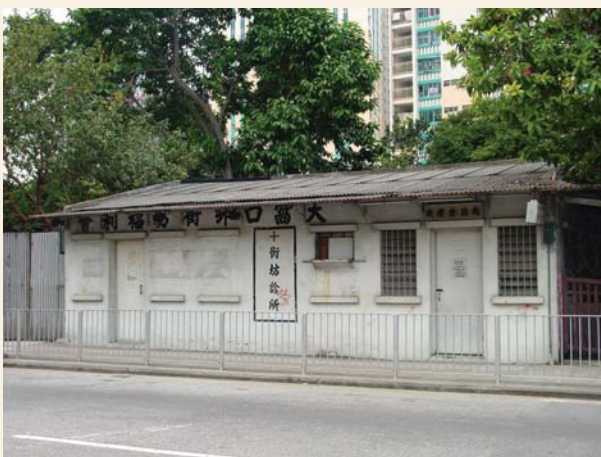
大窩口邨街坊福利會（攝於2003年）

在70年代以前，街坊福利會以贈醫施藥與保障民生福利為目標，代表街坊發言。街坊福利會成員來自各行各業，服務範圍以文娛康體及醫療為主，亦有志願團體從事救濟、教育與醫療等服務。部分團體既服務社區，也扶植地方領袖。 24 早期葵涌、石籬與大窩口等地，都設有街坊福利會，大部份仍如常運作至今，為區內街坊服務。