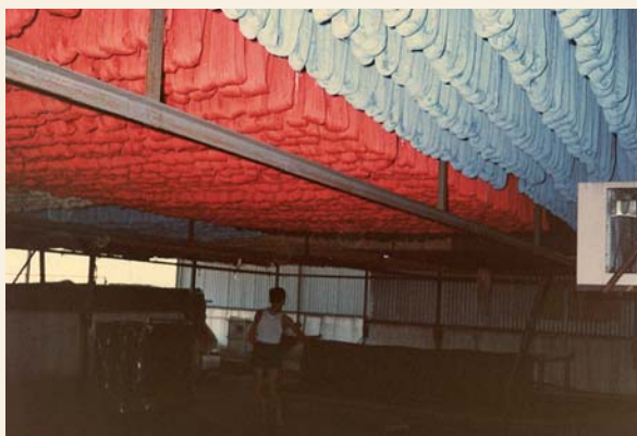
1985年位於青衣的漂染廠