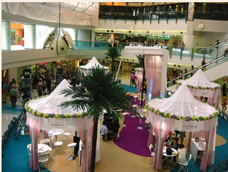
新都會廣場天晶館是展覽的好場地（攝於2003年）

現時的新都會廣場以四季為室內設計主題，設計富時代氣息。在商戶組合方面，更引入不少首次在葵青區開設分店的名牌商號及特色食肆， 56 包括快餐店、咖啡室、西餐廳、泰國菜館、日本菜館及廣東式酒樓，食品種類各式各樣，務求令食客大快朵頤。廣場3樓設有露天噴泉廣場，是全港首個以真沙真石鋪砌，營造沙灘大自然感，切合夏天主題的場地，而廣場中央建有一座別具特色的互動噴水池供顧客及遊人觀賞遊玩。 57