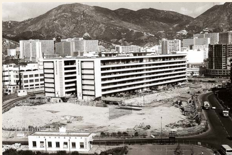
攝於70年代，葵涌七層高的舊式工廠大廈。