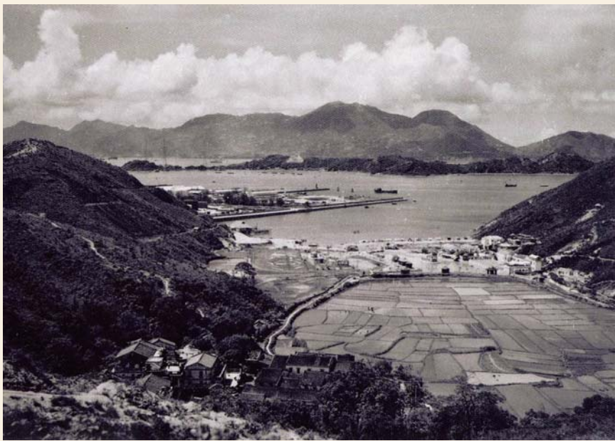
50年代九華徑村，漫山農田。

300多年前聚落在葵青的客家人，與中國其他地區一樣，主要都是以農耕捕魚維生。雖然葵青一帶山峰連綿，平地甚少，但各姓族的鄉民仍然依山傍水，辛勤地開墾土地。他們偶爾也會出海打魚，增加糧食，幫補生計。隨著時代的變遷，不少村民改以海員為業，既可增廣見聞，又可賺取薪金。直到60至70年代，葵青開始由鄉村發展為新市鎮。