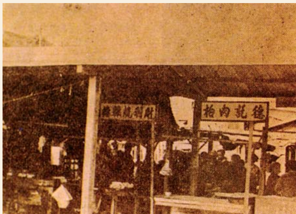
60年代青衣舊墟一景

舊墟最繁華的地方就在今天青衣鄉事委員會的位置。那處每天也會有3至4頭燒豬在掛賣，生意比荃灣的還要好。商店天天營業，店前會有人擺地攤售賣豬肉及其他日常用品。大街內每天有新鮮蔬菜售賣，全部由當地菜農供應。當時整條大街有超過20間的商店，包括雜貨店、茶樓、魚檔、肉檔及餅店等。 18