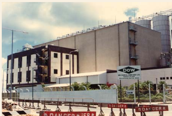
80年代的陶氏化學（香港）有限公司 (轉載自Wong, Y.S., The Development of Heavy Industry in Tsing Yi )

除了以上各種工業外，不少重工業於60至70年代亦有在青衣設廠，例如中華電力於1969年開設發電廠；永固紙品廠於1970年在青衣開業 50 ；以及1970年國際貨箱有限公司（International Containers Limited）設廠建造及維修貨櫃等 51 。雖然這些工廠現在已遷離青衣，但它們亦曾為青衣重工業的發展寫下光輝的一頁。