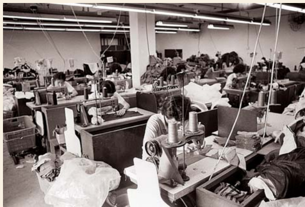
葵安工廠大廈內的製衣工場（B001213）