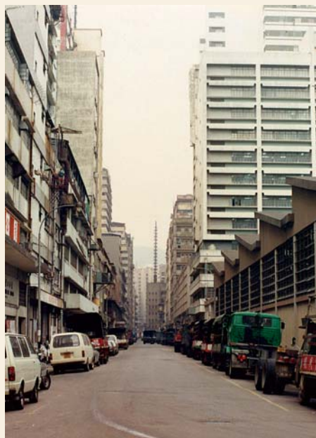
1983年葵涌工廠區的街道

1980年，從事紡織及製衣業的工人，平均月入超過1,000元。 26 當時葵涌的製衣廠通常是中小型廠房，產品以牛仔褲及年青人服裝為主，薪酬以件工計算，工人多數是女工。紡織業廠房規模較製衣廠大，通常實行三班制，日夜不停生產。當年一名紗廠工人回憶：「當夜班的日子，我一個人要看著兩大台機器，幾十枝軸上的棉紗都不可以斷……廠房空氣中飄著棉絮，工作時間頗長。」