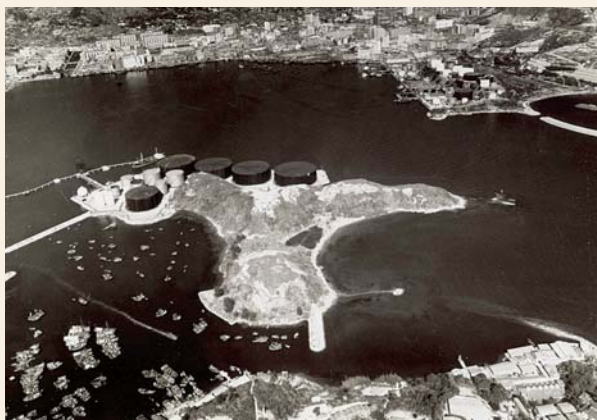
昔日的牙鷹洲是油庫的集中地（葵青民政事務處提供）