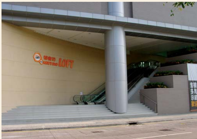
「多用途空間」概念設計的都會坊（攝於2003年）

葵涌由工廠大廈改建而成的都會坊（Metro Loft）正式落成發售，為全港首個利用多用途空間概念（loft concept）設計的大廈，單位可作工作廊、休閒辦公室、錄音室、藝術興趣室、舞蹈室、設計坊及展覽廳等之用。 62 這正是本港利用空置工廠大廈轉作商貿投資用途的先鋒，同時亦加速了本港創意工業的發展。單位開售至今，反應良好，可見葵青區未來確是充滿機遇！