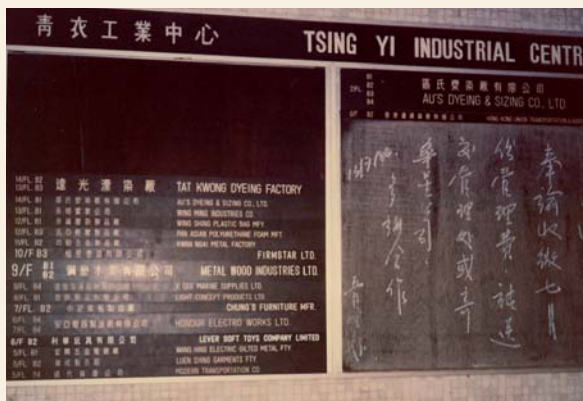
1985年的青衣工業中心