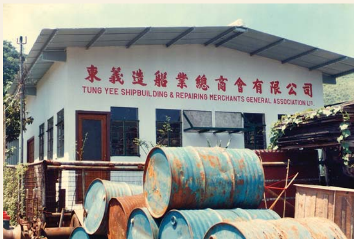
80 年代位於青衣的東義造船業總商會有限公司 (轉載自 Wong, Y.S., The Development of Heavy Industry in Tsing Yi )

船廠一般佔地 17,000 呎，其中 15 家船廠佔地 34,000 呎，各船廠在 1966 年合計有員工約 3,000 人， 34 多為青衣以外的居民，每天乘坐西約的舢舨到青衣上班 35 。青衣各船廠東主不久組成東義造船業總商會有限公司，為船廠謀求福利及爭取權益。 36 早期船廠負責造船及修理本地約 200 噸的內河船；隨著本港口岸貿易繁盛發展，船廠也維修 1,600 噸左右的外來船隻。 37 80 年代，有 18 家船廠加入了青衣商會成為會員，船廠工業的興盛由此可見一斑。 38 政府自 90 年代起決定將青衣北岸一帶土地改作住宅用途，青衣一眾船廠備受壓力，慢慢往西面鑊底灣方向移去，業務逐漸萎縮。