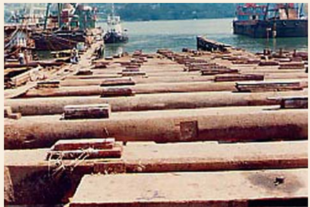
1985年青衣的船廠一景

1964年九龍長沙灣填海，該區30多家船廠集體遷入青衣。 31 港府將臨海地段，用暗標方式開投，投得地段的船廠要自行開山填海建廠，建成船排才能開業。遷到島上初期，船廠其實面對很多困難，包括水電供應、對外交通及員工招聘等。幸好這些問題最終也一一解決了，船廠在青衣逐漸蓬勃發展。 32 當時還有30多間店舖，像士多、五金舖、食肆等家庭生意隨船廠遷到青衣，形成北岸以船廠生意為中心的社區。 33