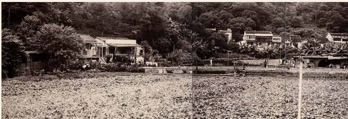
70年代末青衣鹽田角村，仍然廣佈菜田。

一般來說，農村社會家家戶戶都會飼養雞、鴨等家禽，葵青的客家人也不例外。由於養豬的成本較高，只有家境較富裕的村民才能負擔得起。青衣戰前沒有人養豬，村民若想食豬肉便要到深水埗購買。據青衣原居民鄧立持、鄧立輝憶述，大王下村四分一村民養豬，平均每戶有2至3頭，先由幾戶家境較富裕的村民出錢購買小豬，約2至3毛錢一斤，再由村民輪流負責餵飼。 3 每戶人家飼養小豬幾個月，到年尾就把豬隻屠宰。每戶負責養豬的村民均可獲分一份豬肉，不少村民會把豬肉拿到市集出售。