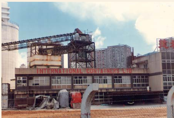
80年代的國際貨箱有限公司