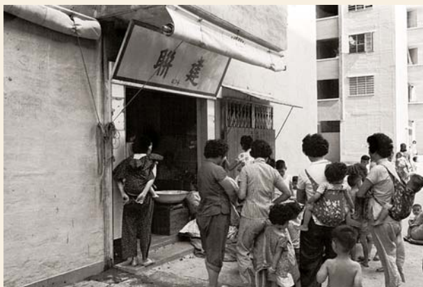
1963年大窩口邨的膠花廠（香港房屋委員會提供·B003925）

60年代初，由於荃灣的工業用地不敷應用，有6、7家工廠選址在葵涌開業，例如東亞太平洋紡織廠、大隆染廠、運通製衣廠、寶星紡織廠等。早年荃灣及葵涌地區交通不便，較大型的工廠通常備有飯堂供工友用膳，更備有廠車接送工人上下班。有位於蚊蟲容易滋生位置的工廠，更每日強制工人服食金雞納霜丸，以預防虐疾。 22