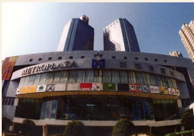
葵芳新都會廣場

於1990年落成的新都會廣場位於葵芳，是新界其中最高的建築物。廣場由兩座46層高的寫字樓大廈及一個5層高的購物中心組成。 54 新都會廣場總建築面積達150萬平方呎，商場面積達54萬平方呎，為葵青區規模最大的商場。購物商場上蓋的兩座35層高甲級商業大樓，寫字樓面積達100萬平方呎，提供了偌大及管理完善的工作空間。 55