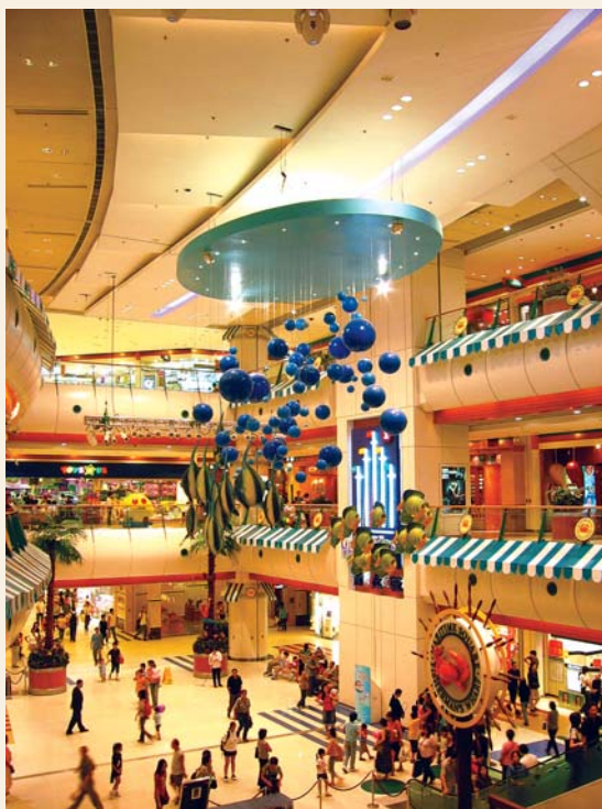
以海洋為主題的青衣城每天都有不少市民在購物 （攝於2003年）

過去青衣城內曾設有全港首個室內主題市集——「舊墟」，記錄了香港昔日獨特繁華的都市色彩。舊墟內以主題街道分成不同的區域，包括赤柱大街、中央街市、渣甸坊、廟街、燈籠街、雀仔街及石板街，內有充滿懷舊色彩的商店及攤檔，例如傳統小食、掌相、字畫、剪紙及手工藝等， 61 令遊人仿如置身老香港。舊墟的傳統特色與青衣城的新穎設計可謂相映成趣。可惜舊墟於2001年停止營業，現已無法再睹其風貌了。