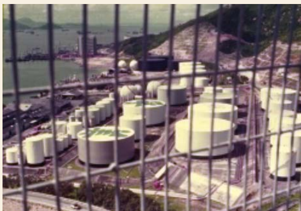
1985年青衣美孚油庫（轉載自Hsi, S.C., Oil Tank in Tsing Yi ）

60年代中期，多間石油公司在青衣及牙鷹洲建設油庫，包括美孚、德士古、標準、高富、東方等石油公司，興建大型裝卸碼頭、石油產品的儲存與分發設施，及潤滑油的摻和、包裝與存放設施等。 43 70至80年代油庫的數目與日俱增，由東北至西南均佈滿大大小小的油庫。早期青衣人口不多，政府也沒有明確提出興建油庫的潛在危機，故青衣沒有居民反對在島上興建油庫。但隨著島上的人口不斷增多，居民開始意識到油庫臨近民居的危險性，在80年代發起一連串運動要求搬遷油庫。最後，不少油庫搬離青衣，位於牙鷹洲的早期油庫被拆卸，而當時毗鄰美景花園的油庫也被迫遷到青衣北部。 44