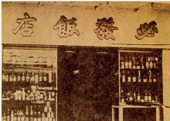
1966年舊墟中的一間飯店

為防止商舖以不誠實的手法欺騙顧客，青衣鄉事委員會設有一把公秤。公秤行每年會在荃灣投標，中標者即可負責下年的公秤。若有人懷疑被商店欺騙，便可花點錢到鄉事委員會要求秤量貨品。使用公秤的費用捐歸天后廟作香油錢，分擔每年舉辦神功戲的費用。