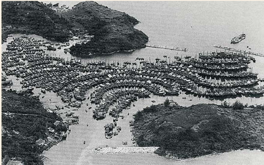
1969年，青衣門仔塘，本來是避風塘，但船隻泊入之後就永不開出，使這裡變成了船屋區。

葵青鄉民捕魚多使用「罾棚」，就是一個大網，有竹把手、籐環，用麻繩製成，多由家庭自製，吊起來形狀似降落傘。有時他們亦會利用魚炮，即炸藥，先把魚群炸暈或炸死，然後才網到船上。整個打魚的過程不是太繁複，只是需要多點耐性及運氣。村民會先把石頭掉在海裡，或在船上燃燒乾草，吸引魚兒注意，待魚群聚集在一起時，用力把魚網的繩索拉起，網住魚群，然後再拖到船上。