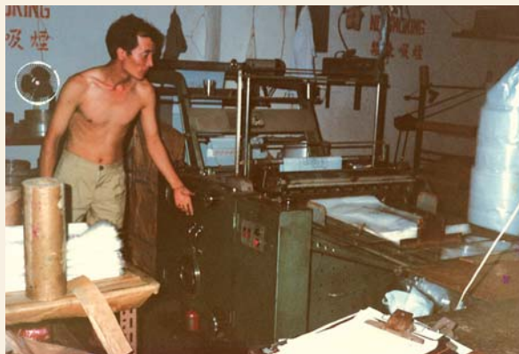
1985年座落青衣的膠袋廠