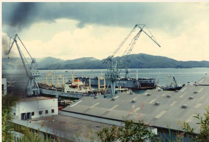
80 年代的香港聯合船塢有限公司

早在 60 年代中期青衣已設有船塢，當時已有一家佔地 130,000 平方米的機器修理廠，擁有 2 個浮塢，替船隻進行維修及檢查。 39 1976 年香港聯合船塢有限公司在青衣西南部落成啟用。90 年代初，該公司更投資 3 億元添置新式現代化設備，使之成為現時香港規模最宏大的船塢之一。 40 船塢除了為泊靠的船隻維修外，設有浮塢，包括維修船隻、改裝船隻、修理鑽油船及彈簧打油井機等。 41 隨著貨運業的興盛，維修船隻的公司都將廠址改為存放和裝卸貨櫃之用，現時船塢的面積日漸減少，取而代之出現的是貨櫃裝卸區。 42