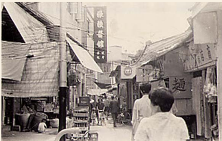
70年代中期的青衣大街

青衣老一輩的居民必定到過青衣舊墟。無論是商販還是顧客，只要走到舊墟必能有所收穫。舊墟的位置就在現時青衣邨及青怡花園一帶，即以前的青衣塘附近。1982年，政府為發展青衣，決定把青衣塘清拆，舊墟亦隨之而消失。但要說青衣的故事是不能不說舊墟，因為它是當時青衣的心臟。現在就讓我們一起走到包羅萬象的舊墟穿梭，共同懷緬昔日繁榮的景象。