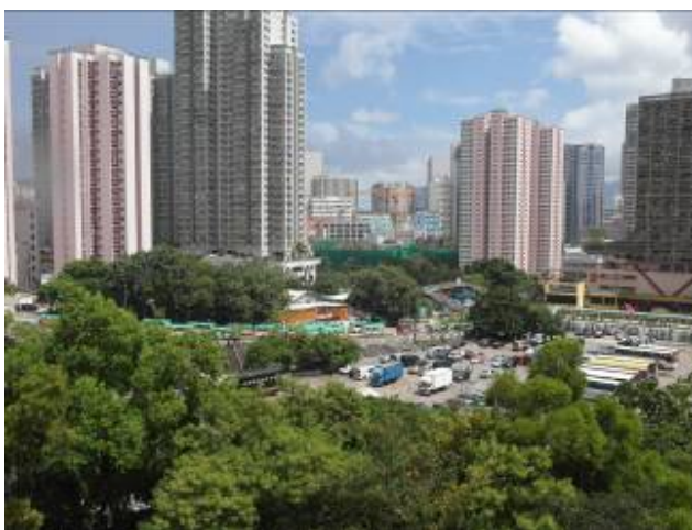
圖中所見之處都是昔日「竹園鄉」所在