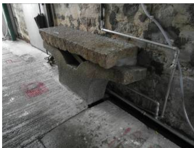
昔日鄉中染布廠遺下的「碾布石」