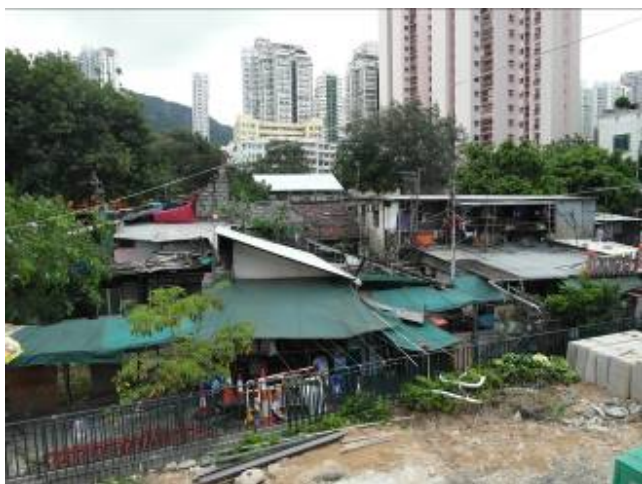
碩果僅存的竹園鄉