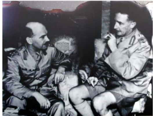
左為英軍總司令莫德庇少將，右為羅遜准將

1941年，羅遜時任渥太華軍事訓練學院總監，第二次世界大戰爆發後，受命指揮加拿大皇家來福槍營及溫尼伯榴彈兵營等加國軍隊增援香港。在香港保衛戰中，他負責指揮港島兵旅，同年12月，日軍南下香港，新界、九龍迅速失守。英軍退守香港島，羅遜准將轉為指揮以皇家蘇格蘭營、溫尼伯榴彈兵營及印度旁遮普營組成的港島西旅。港島東線由窩利斯准將指揮；同年12月19日，羅遜領導的港島西旅指揮部在黃泥涌峽被日軍包圍，領兵突圍時戰死。是加拿大軍在第二次世界大戰中戰死的最高級官員。戰後羅遜准將的遺體遷葬於西灣國殤紀念墳場。